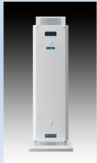
エアーリア コンパクト