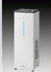
エアーリア デュアル